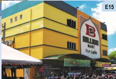
Pasar Raya Hero