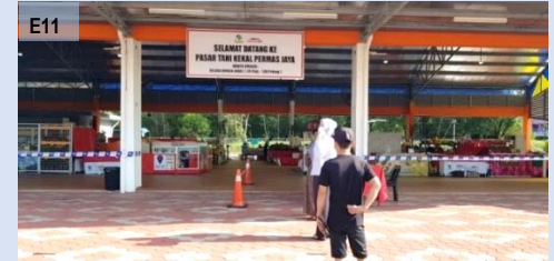
Pasar Tani Kekal Permas Jaya, Johor

Pasar Basah dan Kering : Wet and Dry Market Menempatkan aktiviti penjualan barangan makanan harian seperti ikan, sayur-sayuran, buah-buahan dan sebagainya. (e 17 )