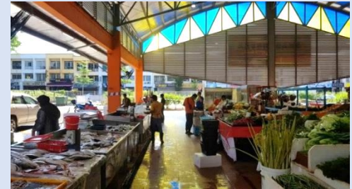
Ruangan pasar basah di Pasar Tani Kekal Permas Jaya, Johor