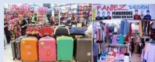
Pusat Pemborong GM Klang, Selangor