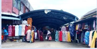
Kawasan Bebas Cukai Pengkalan Kubor, Kelantan

Premis perdagangan yang ditempatkan di dalam lorong berbumbung atau di dalam bangunan yang menempatkan aktiviti perniagaan kecil-kecilan. (e 10 )