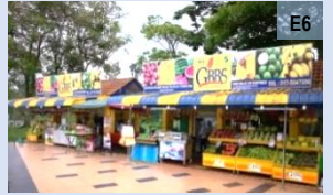
Gerai buah-buahan FAMA

Aktiviti perniagaan informal yang wujud di pusat bandar, pusat kejiranan, kawasan perumahan, kawasan perindustrian dan kawasan institusi yang menjual pelbagai barangan, minuman dan makanan dalam ruang yang disediakan secara statik atau sementara dan lebih kecil daripada kedai. (e 12 )