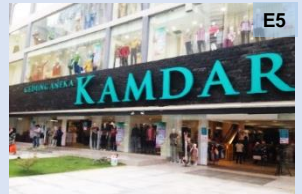
Gedung membeli belah Kamdar

Adalah gedung dengan pelbagai saiz ruang lantai perniagaan yang menjual pelbagai jenis barangan pengguna yang dibahagikan mengikut jantina, umur dan barangan keperluan rumah, melalui layan diri atau dengan jurujual, secara amnya di bawah satu pengurusan. Departmental store boleh menyediakan ruang untuk pasar raya tidak lebih daripada 3,000m 2 . (e 11 )