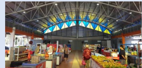
Ruangan pasar kering di Pasar Tani Kekal Permas Jaya, Johor