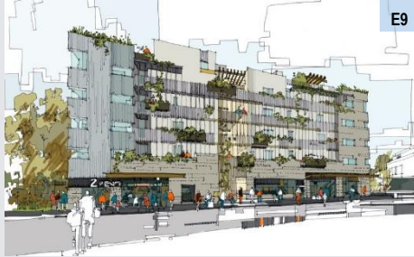
Service Apartment Residensi AVA@Kiara Bay, Kuala Lumpur

Unit-unit kediaman berbilang tingkat yang menyediakan kemudahan perkhidmatan kepada pemilik atau penyewa seperti hotel. Pangsapuri perkhidmatan dikategorikan di bawah guna tanah komersial. (e 16 )