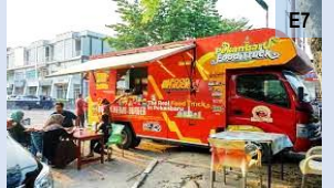
Tapak food truck

Kawasan yang disediakan untuk mengelompokkan penjaja bagi menjalankan aktiviti perniagaan makanan, minuman atau barangan secara sementara seperti pasar malam, pasar tani, pasar minggu dan food truck . (e 13 )