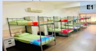
Swan Inn Youth Hostel, Masai, Johor

Penginapan jangka masa pendek untuk pelawat dan pengembara termasuk juga penginapan jangka masa panjang untuk pelajar, pekerja dan individu yang seumpamanya contohnya resort, chalet, youth hostel . (e 5 )