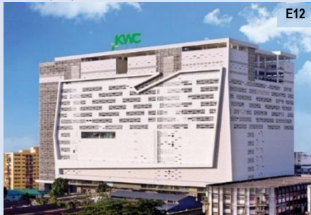
Kompleks Kenanga Wholesale City, Kuala Lumpur

Menempatkan aktiviti jual beli barangan secara pukal. Ia menawarkan perkhidmatan untuk tadahan penduduk yang ramai dan kawasan yang lebih luas. (e 18 )